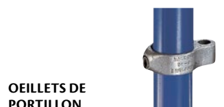
OUILLETS DE PORTILLON