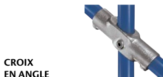
CROIX EN ANGLE