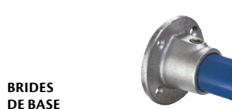
BRIDES DE BASE