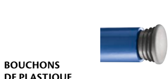
BOUCHONS DE PLASTIQUE