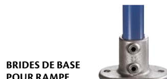
BRIDES DE BASE POUR RAMPE