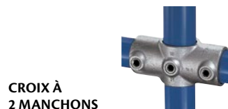
CROIX À 2 MANCHONS