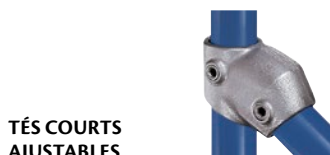
TÉS COURTS AJUSTABLES