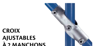
CROIX AJUSTABLES À 2 MANCHONS