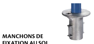
MANCHONS DE FIXATION AU SOL