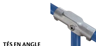
TÉS EN ANGLE