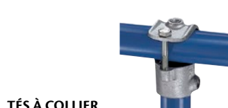
TÉS À COLLIER