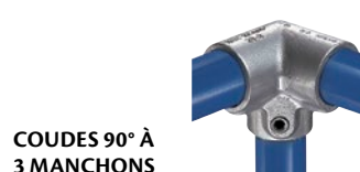
COUDES 90° À 3 MANCHONS