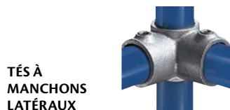
TÉS À MANCHONS LATÉRAUX